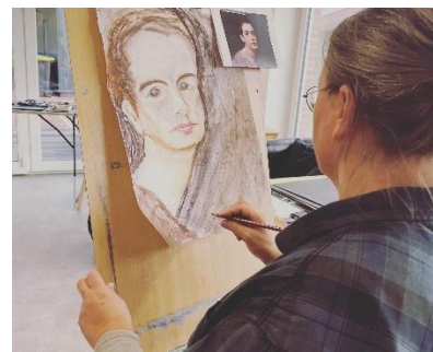
Teilnehmerinnen am Werk