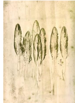
Arbeiten in verschiedenen Drucktechniken