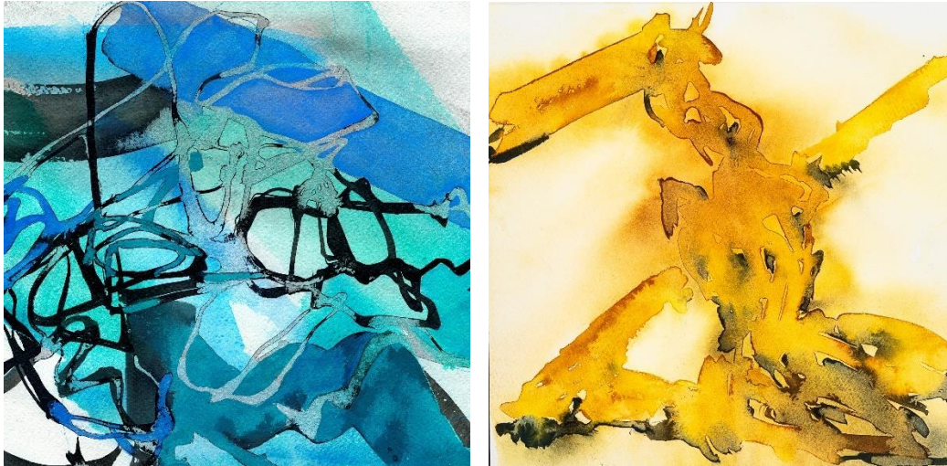
Experimentelle Aquarelle: Jutta Höfs