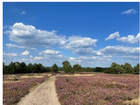
Unterwegs in der Landschaft rund um Schneverdingen