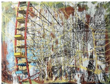
Ursula Blanke Dau

Weitere Bilddateien unter: www.heidekultour.de/downloads